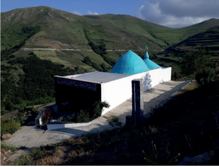
Resim 6. Gülder Köyü, Gülder Hüseyinî Seyyidlerî'nin Mezarı.