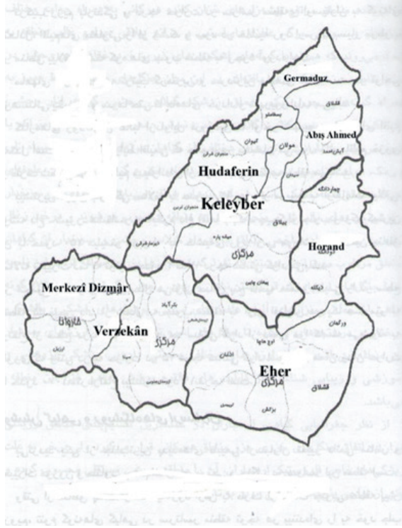
Harita 1. Günümüzde Karacadağ Bölgesi'nin Sınırları (Şahhüseyini, 1384: 23).