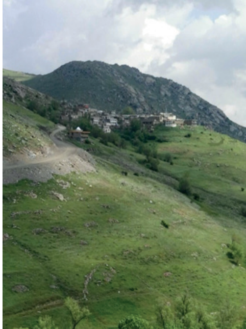
Resim 5. Gülder Köyü (Şahsî Arşivden).