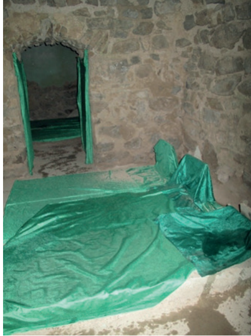
Resim 8. Gülder Seyyidleri'nin Mezarı, İç Mekânı.