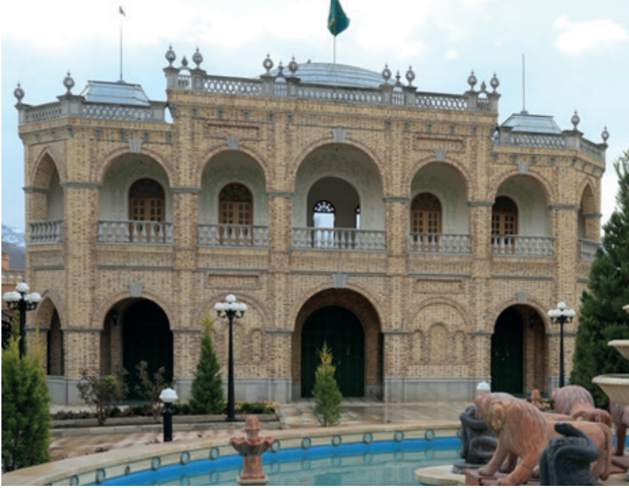
Resim 10. Gerebân'da buluna Ateşbeygî Ocağı Cemhanesi.