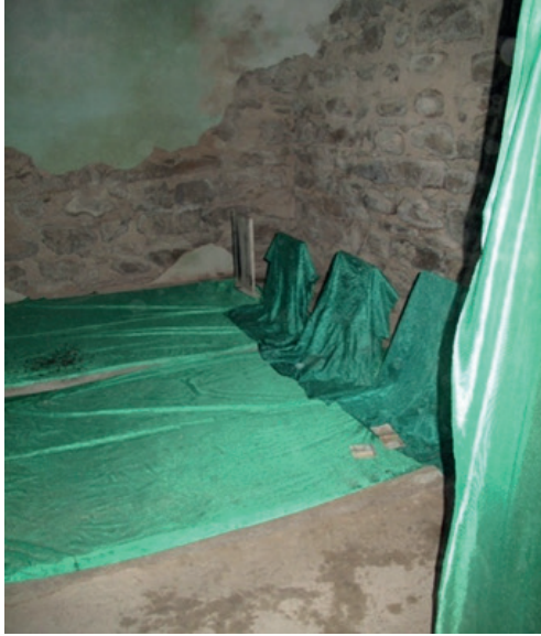
Resim 7. Gülder Seyyidlerî'nin Mezarı, İç Mekânı.