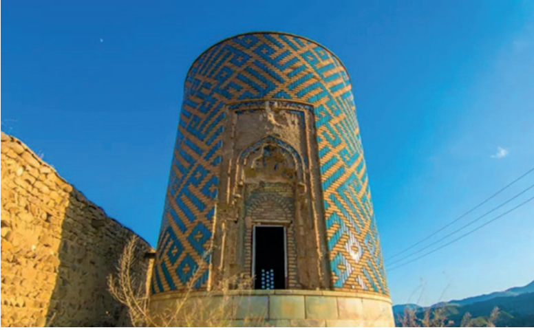
Resim 4. Verzikan İlçesi, Allah Allah Kubbesi, https://l24.im/IqkGh (20.11.2024).