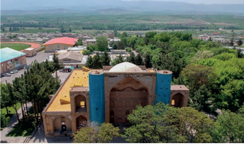
Resim 2. Şeyh Şihabeddin Eherî'nin Türbesi (Eher), https://124.im/2BXw (20.11. 2024).