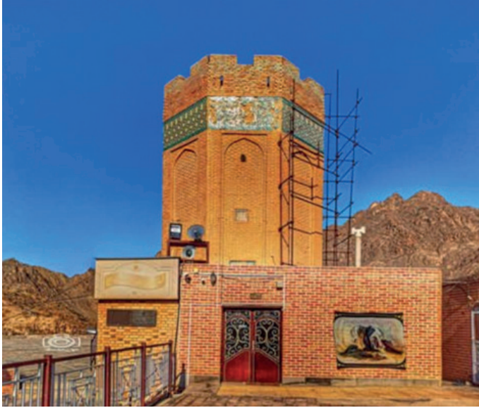
Resim 3. Duzal Kulesi (Duzal Köyü, Araz Nehri / Siyehrud), https://124.im/JwI5qF (20.11. 2024).