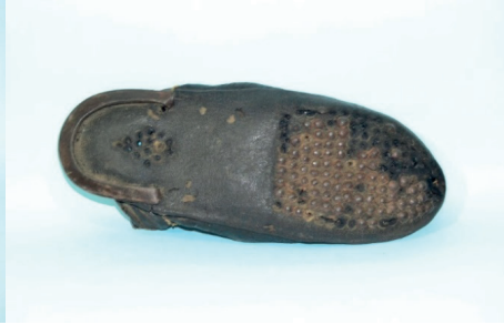
Fotoğraf 15. Şah'ın Pabucunun Antalya'daki teki, Altından Görünüm, 2020.