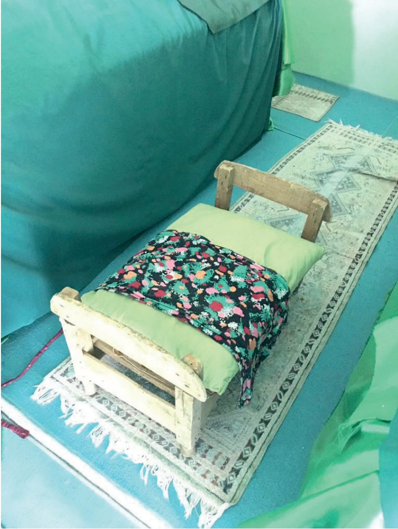
Fotoğraf 11. Türbe içinde bulunan tahta beşik. (Ağlayan, hasta olan ya da uyumayan çocukların türbeye getirilerek içine yatırıldığı ve bu sayede iyileşme umulan beşik), 2022.