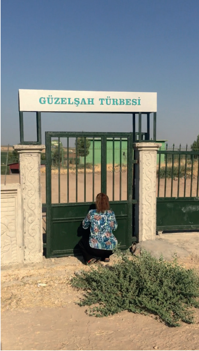
Fotoğraf 6. Türbe Ziyaretçilerinin Oturarak Bahçe Kapısını Açması, 2019.