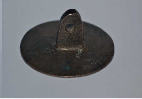
Fotoğraf 20. Üzerinde Ashab-ı Khef'in adlarının yazdığı mühür, Altan Görünüm, 2020.

Kur'an- Kerim'in 18. Suresi olan Khef Suresi'nin 9-26. Ayetleri 'nde Ashab-ı Khef kıssasının bazı ayrıntıları yer almaktadır. Bu kıssada geçen ve Batı literatüründe Yedi Uyurlar olarak bilinen Ashab-ı Khef kıssası, nesilden nesile sözlü olarak aktarılmıştır. Hristiyan ve İslam kültüründe çok sevilen Yedi Uyurlar'ın, Tanrı tarafından korunması ve ölümden sonraki hayata bir delil olarak düşünülmesi; çeşitli sanat eserlerinde adları yazılmak suretiyle birer tılsım olarak nazar ve kötü iyelerden korunmak amacıyla kullanılmasını sağlamıştır.