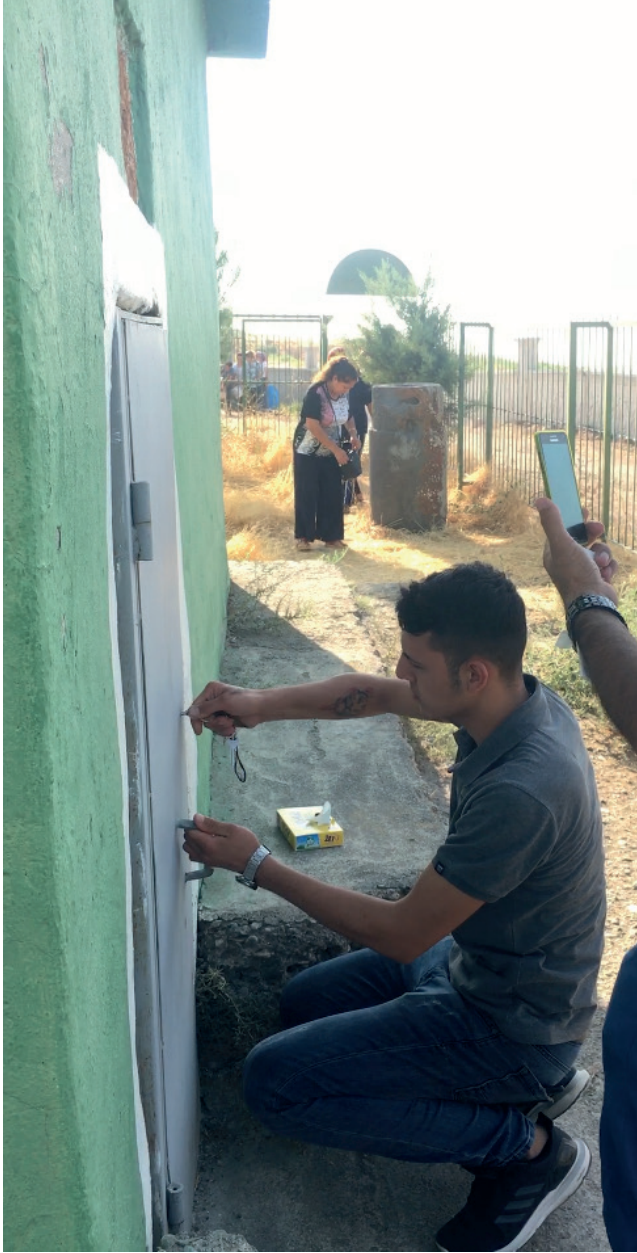
Fotoğraf 9. Türbe Ziyaretçilerinin Oturarak İç Kapıyı Açması, 2019.