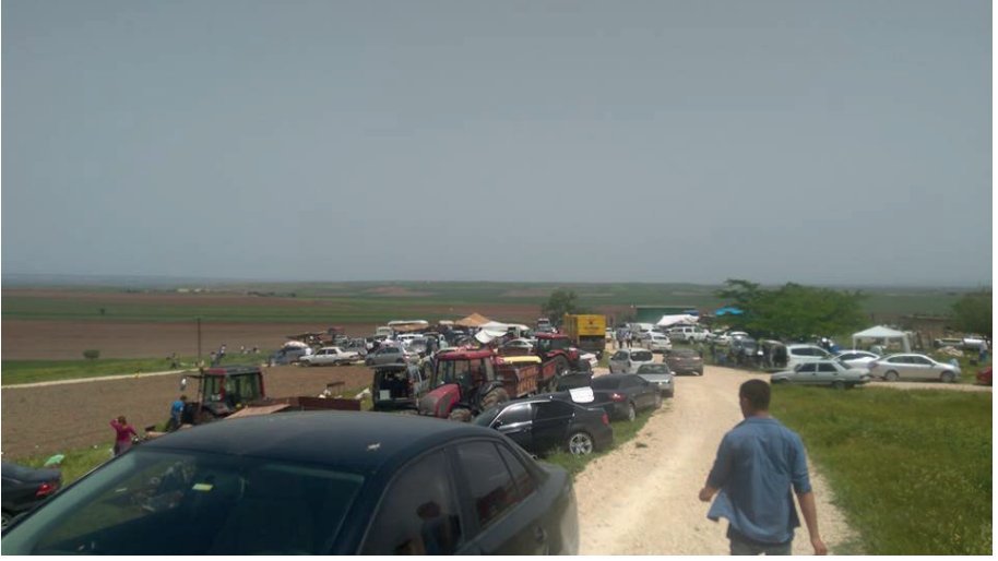
Fotoğraf 4. 2017 yılı Mayıs Ayı, Taliplerin Türbe Ziyaretinden bir Görünüm.