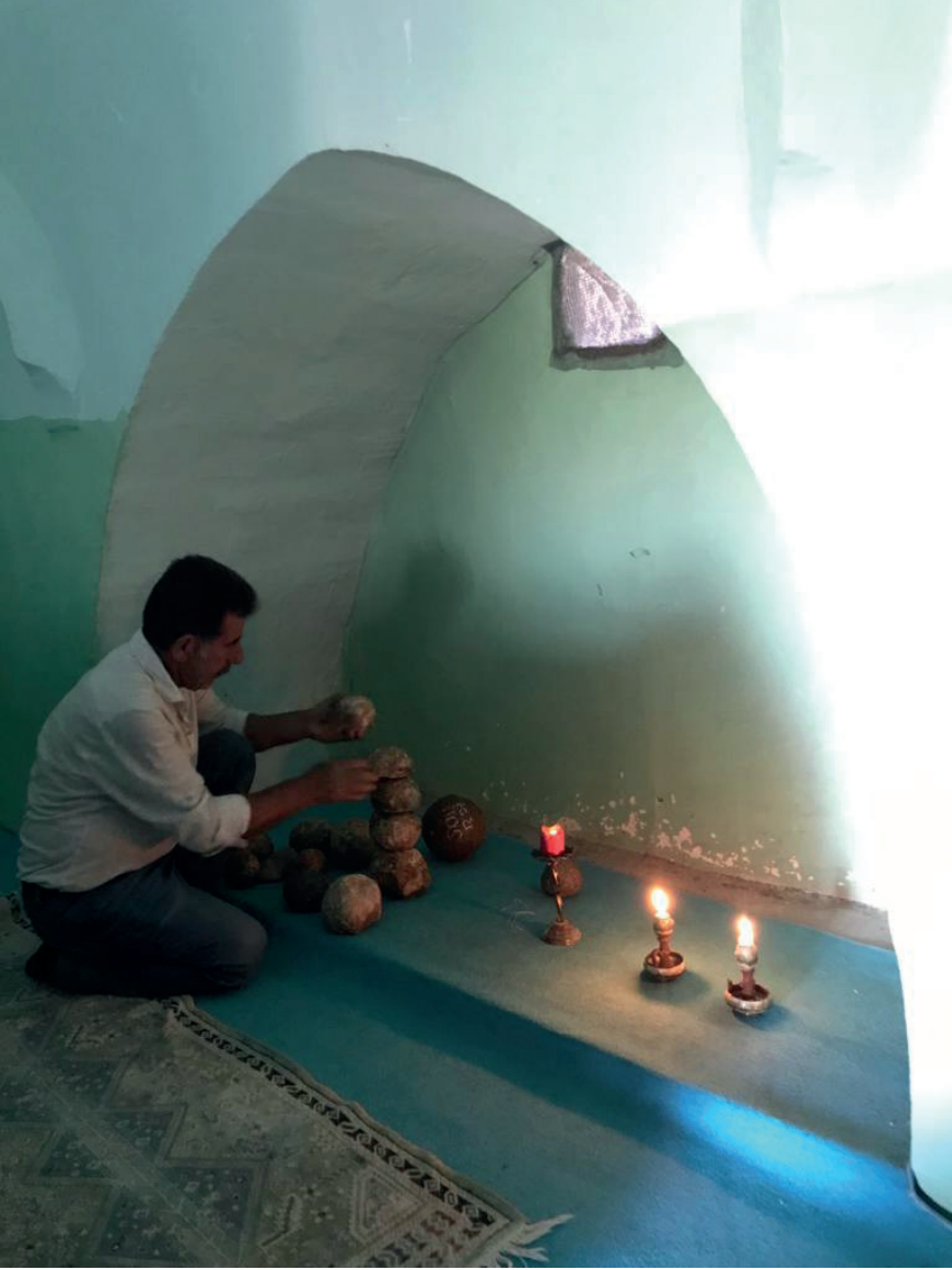
Fotoğraf 12. Türbe içinde delil uyandırma ve dilek gerçekleşmesi için taş dizme, 2022.