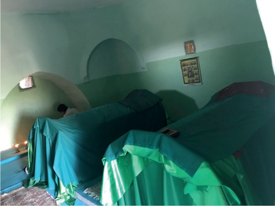
Fotoğraf 10. Türbe İçinden Bir Görünüm, Güzelşah Dede'nin Mezarı(şagda), 2. Menkibe Konusu Bey Oğlunun Mezarı(solda), 2021.