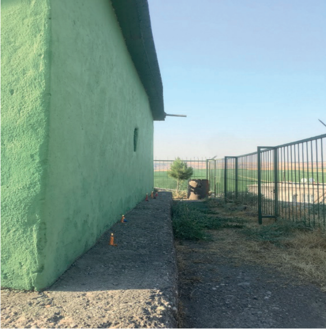
Fotoğraf 5. Türbe Duvarlarının Önünde Dilek Dileyenlerin Mumları, 2019.