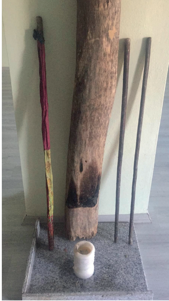
Fotoğraf 22. Soldan Sağa sırayla; Görgü Ağacı, Üç boğumlu/çizgili (Allah-Muhammed-Ali üçlemesini temsilen); Kakma (Ocak direği), Görgü ağaçları ve En Önde Mermer Çerağlık, Gürsel Yiğitler Arşivi, 2020.

Türkmenlerinde bu kutsal ormana “Karaoğlan” denilirdi. Kurban edilen hayvanların kemiklerini bu ormana sakladılar (Dağlar, 2019: 104).