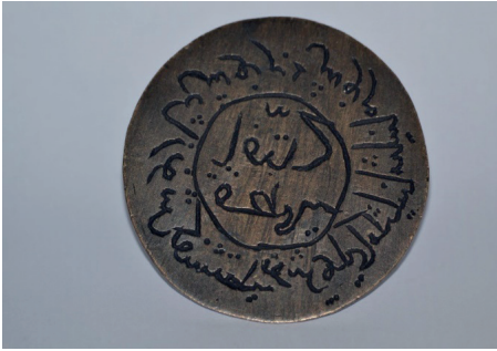
Fotoğraf 19. Üzerinde Ashab-ı Khef'in adlarının yazdığı mühür, Üstten Görünüm, 2020.