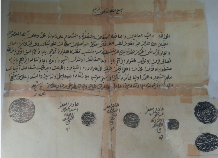
Resim 5: Koçu Baba Ocağı’na ait icâzetnâme