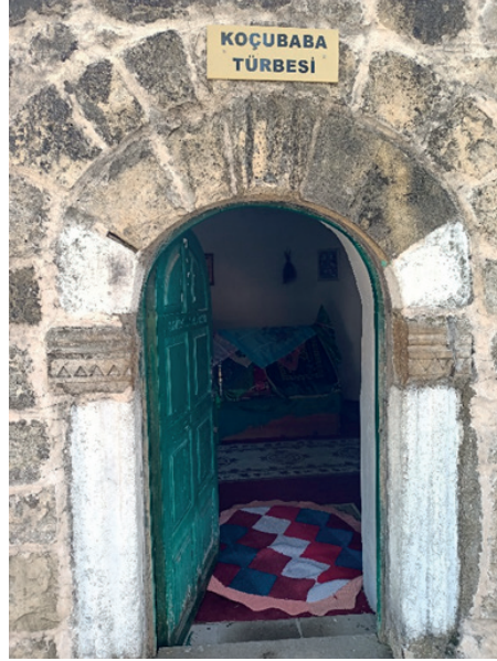
Resim 1.a-1.b: Koçu Baba Türbesi dıştan görünüş ve giriş kısmı