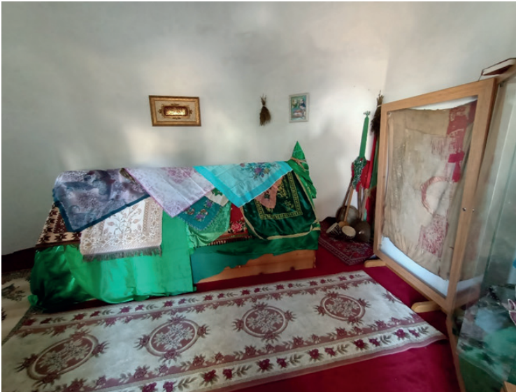
Resim 2: Türbenin iç kısmı