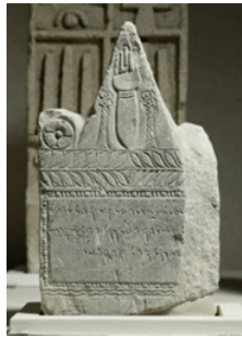
Resim 4. Fenike Tanrıçası Tanit'in Eli

Fenikeliler de Kartaca'nın (günümüz Tunus'u) koruyucu tanrıçası ve ay döngüsünün denetleyicisi Tanit'i temsil etmek için bir el imgesi seçmişlerdir. Tanit Fenikelilerde/Kartacalılarda Asherah'ın ismiydi. Yani Asherah'ın daha sonraki bir versiyonuydu (Tahor, 2022). Aynı figür Yunan mitolojisinde Aphrodite'in Eli olarak karşımıza çıkmaktadır. Kadınları nazardan korumak, doğurganlığı ve emzirmeyi arttırmak, sağlıklı hamileliği desteklemek ve zayıfları güçlendirmek gibi koruma niyetleri için kullanıldığı görülmektedir (Sonbol, 2005: 355-359). Buraya kadar, tanrıçalarla özdeşleşen el sembolünün farklı toplumlarda benzer amaçlarla kullanıldığı görülmüştür. Son zamanlarda yapılan arkeolojik çalışmalar neticesinde el sembolünün bu gibi anlamlar taşıdığı düşüncesi pekiştirilmektedir.