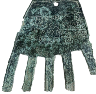
Resim 5. Irulegi arkeolojik alanında bulunan el sembolü

2022 yılının sonlarına doğru arkeologların, İspanya'nın kuzeyindeki Navarre bölgesindeki günümüz Pamplona'sına yaklaşık 8 km uzaklıktaki Aranguren Vadisi yakınlarında bulunan Irulegi arkeolojik alanında buldukları el sembolü, bu yeni çalışmalardan birinin ürünüdür. M.Ö 1. yüzyılın ilk çeyreğine tarihlenen, el sembolü ile ilişkili olan bu son keşif aynı zamanda arkeologların; en eski Bask dili metni olduğuna inandıkları bir metin içermektedir. Metinde çevrilen ilk kelime ise modern Baskça dilinde “iyi talih” ya da “iyi alamet” anlamına gelen “zorioneko” kelimesine kolayca çevrilen “sorioneku”dur (Arkeonews, 2022). Objenin üzerimde aynı zamanda, evin kapısına asılmak için üzerinde bir girinti bulunmaktadır. Objenin üzerindeki yazıyla birlikte düşünüldüğünde; bu el figürünün bu toplumda da evi korumak için ritüel bir nesne olarak kullanıldığı, iyi şans ve bereket getireceğine inanıldığı çıkarımına varılabilir.