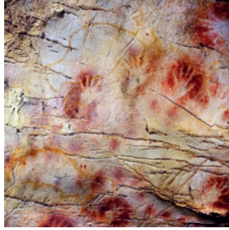
Resim 2. El Castillo Mağarası-İspanya

Whitley ise avlanma sahneleriyle birlikte resmedilen el figürlerini, ruhlar dünyasıyla bağlantı kurmaya çalışan şamanların trans halindeyken yaptığını ileri sürmektedir. Buna göre el şekilleri, dinsel bir yaklaşımla tekrarlanmıştır. Aynı zamanda kimi avcı toplayıcı toplumlarda şamanların kadın olduğunu da belirtmektedir. Keşfin sahibi Snow, bu kadim sanatçıların neden bu izleri bıraktığı sorusuna ise; bu izlerin “Bu benim, bunu ben yaptım.” mesajı vermek için bırakılmış olabileceği yanıtını vermektedir (National Geographic, 2013). Gerçekleştirilen bilimsel çalışmalar ve yapılan yorumlar neticesinde günümüzden 38 bin yıl evvel; bu el figürlerinin, yaratıcılığı temsilen kullanıldığı söylenilebilir. Yapılan araştırmalar gösteriyor ki geçmişte mağara kadınları tarafından yaratmanın bir kanıtı olarak kullanılan el figürü; sonrasında da yaratıcı gücün, kudretin, hükmetmenin sembolü olarak kullanılmış ve tanrıçalarla özdeşleştirilmiştir.