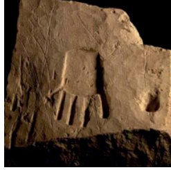
Resim 3. Hebron bölgesi yakınlarında bulunan, 8. yüzyıla ait üzerinde el işareti olan yazıt ( https://treespiritwisdom.com/2022/05/31/june-oak/ . Erişim tarihi: 03.11.2022.)