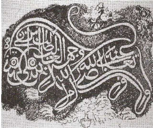
Aslan Yazı Resmi, Özel Koleksiyon, İstanbul (Thierry Zarccone)