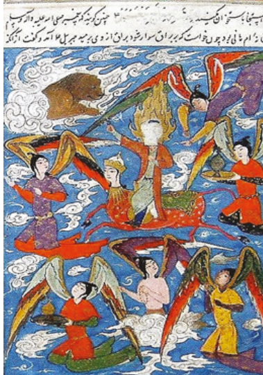
Mi'rac, Kısas-ı Enbiyâ, 1550-1600, olasılıkla Şiraz, Topkapı Sarayı Kütüphanesi H. 1228, fol. 152v.