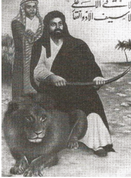
Hz. Ali, Aslan ve Kanber, 20. Yüzyıl, İran (Fahmida Suleman)