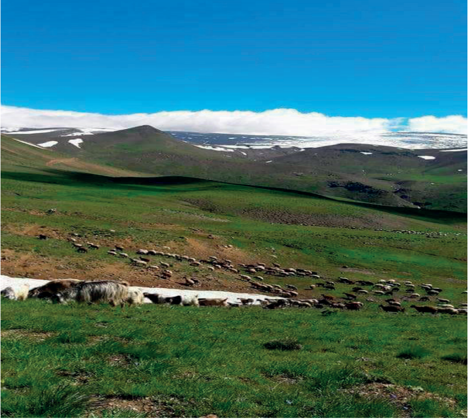
Goşkar Baba Yarlısu Köyü

Alevilerinde musahiplik kadar önemli bir kurumdur. Ayrıca üzerinde herhangi bir mezar bulunmamasına rağmen kutsal mekân sayılıp onlar için kurban kesilen dağlar da tespit edilmiştir. Goşkar Baba, Şeyid-i Keloşke, Gire Boğa... bunlardan birkaçıdır.