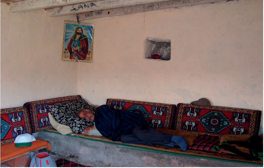
Hızır Çeşmesi Gölyayla Köyü (Kutsal mekânda uyuma)

Varto Alevi inancına göre, ziyaretler kutsal mekânlardır ve her mekânın bir sahibi/iyesi (Wayır) vardır. Dolayısıyla bu mekânlardaki bu sahipler aracılığıyla dilekler O'na daha rahat ulaştırılabilir inancı hâkimdir. En sık edilen dua ise “Kılavuze to mare wahirtiye bıkero. (Kılavuzun bize sahiplik etsin, bizi koruyup kollasın)”. Buradaki Kılavuz ile kast edilen şey en üst mertebede olan O'dur. Ziyaretin sahibinden aracı olması istenmektedir.