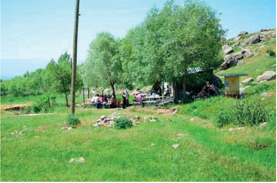
Hızır Çeşmesi Beşikkay Köyü

Varto ve çevresinde yatırlar, ağaçlar, taşlar ve dağların yanı sıra su kaynakları da ziyaret fenomeni içerisinde yer almaktadır. Tek başına ziyaret olan su kaynaklarının dışında diğer kutsalların mekânında bulunduğu için kutsal sayılan sular da tespit edilmiştir. Kutsalın çevresine sirayet ettiği inancı burada da görülmüştür.