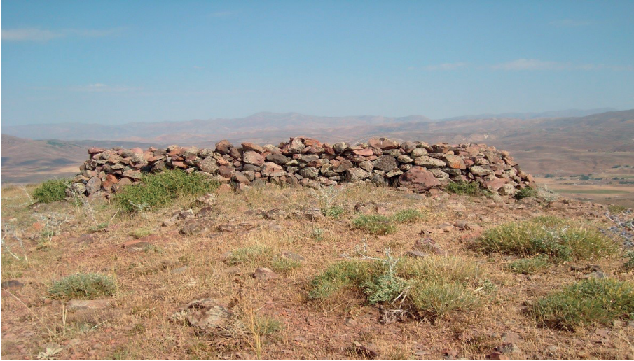
Şeyid-i Gola Onpınar Köyü