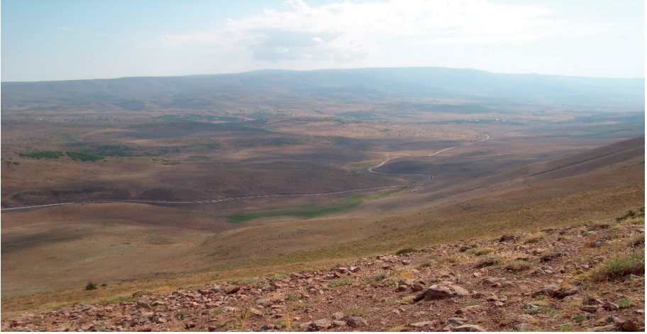
Varto'nun en yüksek noktalarından biri Şeyid-i Gola Onpınar Köyü

Dağların simgesel ve dini değeri çok fazladır. Dağlar göğe en yakın yerlerdir. Gök ile yerin birleşme ve yeryüzünün en yüksek noktası olmasından dolayı, dünyanın merkezinde yer alır. Bütün gök tanrıların kendilerine tapınıldığı yüksek mekânları bulunur (Eliade, 2005: 136).