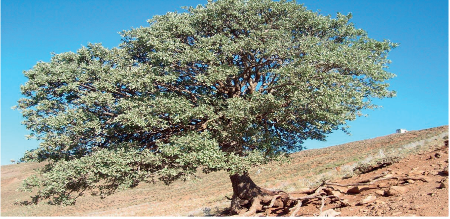
Şeyid-i Ciran Alabalık Köyü

Ağaç her şeyden önce varoluşu, hayatı, canlılığı, bereketi temsil eder (Gürsoy, 2012: 4). Uygurların Yaratılış ve Türeyiş destanında Tanrı insanı ağaçtan yaratmıştır. Tanrı'nın " Dokuz dalın her bir kökünden dokuz insan türesin! " buyruğuyla ağacın dalları altında dokuz insanın yaratılmıştır (Sepetçioğlu, 2010: 29-30). Ağaçtan yaratılma inancının günümüze yansımaysa çocuksuz insanların ağaca ip bağlayıp çocuk isteme şeklinde olmuştur. Varto Alevilerinde de bu inanç devam etmektedir.