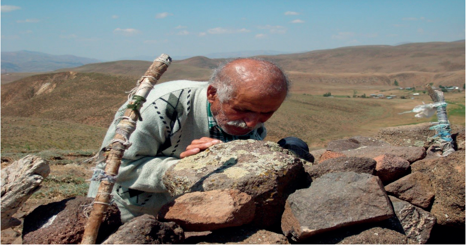
Seqsafi Gölyayla Köyü (Dua-niyaz etme)

Kutsal mekânların ziyaret edilmelerinin birçok sebebi vardır. “ Türk dünyasındaki ziyaret dindarlığı fenomeni, Türklerin gerek ferdi ve gerekse de toplumsal hayatlarıyla hem yapısal ve hem de fonksiyonel bir biçimde bütünleşmiş bulunmakta. ” (Günay, 2003: 26). Kutsalın yoğun olarak hissedildiği yerlerde insanlar kendilerini güvende hissediler (Oymak, 2002: 132). Ziyaret yerleri asırlardan beri insanoğlunun çaresizlik içine düştüğü anlarda, kendisini tatmin ettiği, çıkış yolu bulduğu içindeki manevi boşluğunu doldurduğu yerler olarak ön plana çıkmıştır. Ziyaret yerleri hakkında anlatılan menkıbeler ise, bu ruh haline sahip insanlar için psikolojik yönden ana güdüleyici olmuştur (Yavuz, 2005: 103). İnançlar, toplumun manevi sığınağıdır. Bu sığınak, insanların ruhsal ihtiyaçlarının karşılandığı, kötü arzu ve isteklerden arındığı, huzur ve mutluluğu bulduğu gerçek manevi bir koruyucudur (Gökbel, 1998: 1).