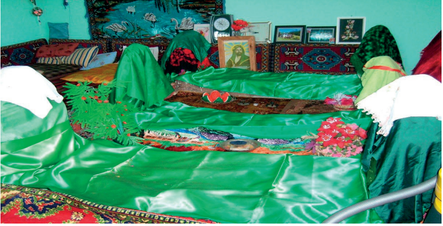
Seyid Nesimi ve ailesine ait olan bu mezarlığın üzerine bir oda inşa edilmiştir. Mezarlık İçmeler köyündedir.

Kureşan ocağının pirllerinden bazılarının Erzincan'ın Tercan İlçesi'nden bazılarının ise Dersim'den geldiklerini tespit edilmiştir. Varto'nun Serçuk köyündeki pirlere Kureşan ocağının mensuplarıdır.