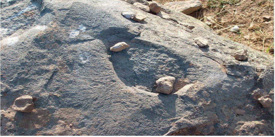
Hızır Çeşmesi Hızır'ın atına ait nal izi Beşikkaya Köyü

Varto'da tek başına taştan oluşan ziyaretler: Arabı Mansur, Nınga Düldülü (Düldülün Ayağı). Varto'da tespit edilen iki Hızır Çeşmesi'nde de Hızır'ın atının nalına ait olduğu söylenen iki taş tespit edilmiştir. Bu taşların yanı başında kutsal olduğu kabul edilen sular da mevcuttur. Bir de Hızır Çeşmesi'nin olduğu yerde köylülerin yapmış olduğu tek odalı yapılar da mevcuttur.