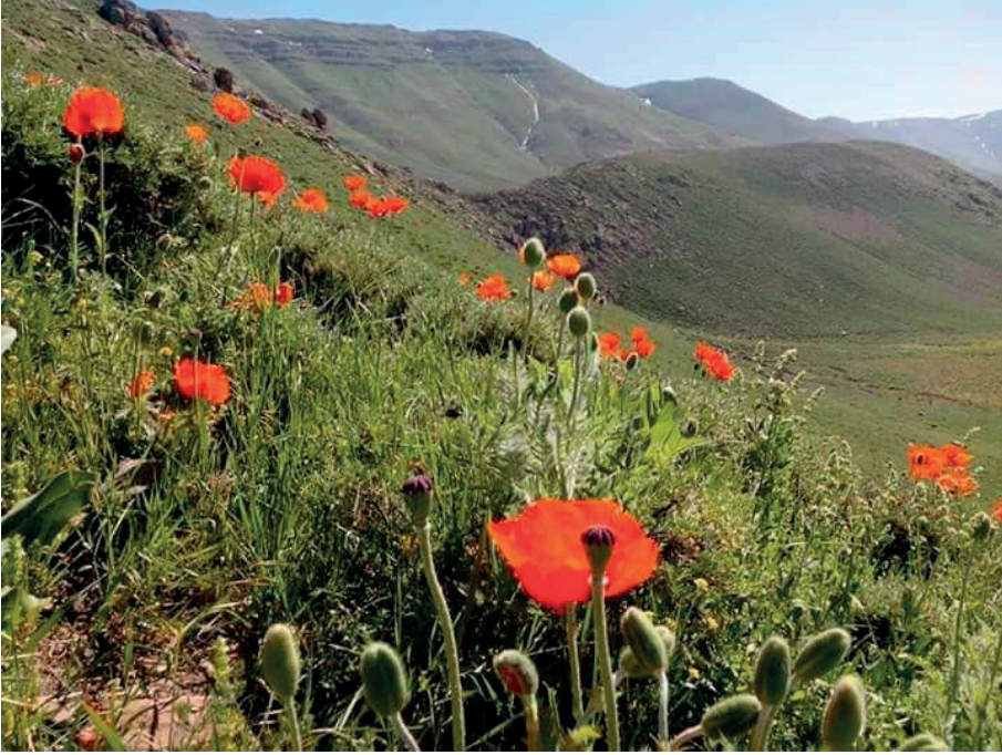
Çelkani Beşikaya Köyü

Varto'da bulunan ve birçok köyden görünen Bingöl Dağları'nın doruklarından akıp gelen Çelkani , tek başına kutsal bir sudan oluşan ziyarettir. Bunun dışındaki kutsal sular; genellikle bir mezarın yanı başında ya da yakınında, bir kutsal ağacın dibinde, kutsal olan dağın başında ya da Hızır Çeşmesi gibi başka kutsallarla birlikte yer alır.