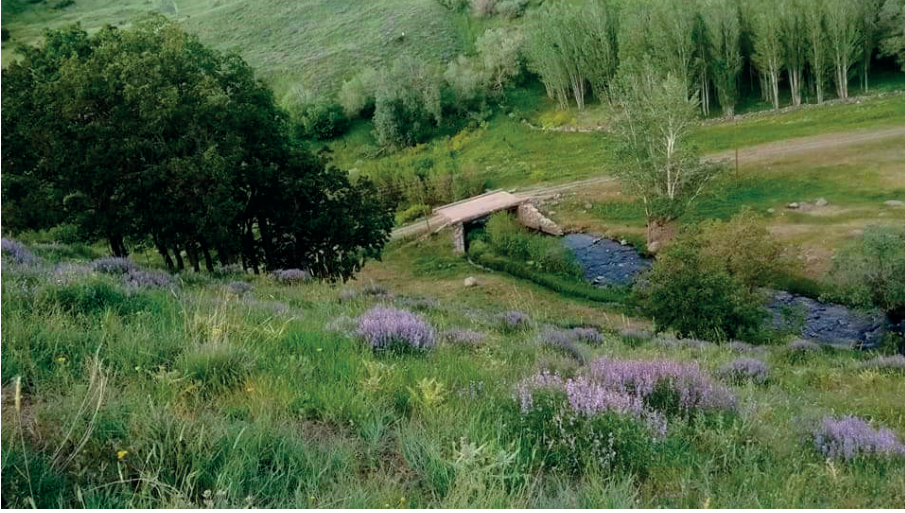
Şeyid-i Kavak Onpınar Köyü