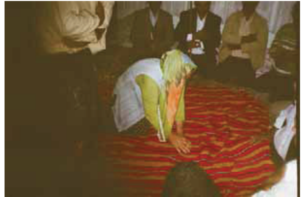
Fotoğraf 13: İçteki kini, kibri dışarı atmak ve kalpleri temizlemek için yeri, elinin içiyle üç kere çalar

Dua bitince birbirlerine niyaz edilir, sonrasında ise Ana Bacı yerden postu kaldırır. Bu andan itibaren, eğer varsa, kurban edilen koçun lokması beklenirken, daha önceden gör-güsü olan kişinin ya da kişilerin hazırlamış olduğu yiyecekler ortaya gelir ve herkese eşit olacak miktarda dağıtılır. Çoğu kişi, akşam, davetin olacağını duyduğu andan itibaren, davete kadar yemek yemez, hatta öğle yemeği dahi yenilmeyerek davet zamanını beklerler. Ortaya konulan ve dağıtılanların yenmeye başlanmadan önce, dede, bu sefer sofrada duasını okur. "Allah, Allah, Allah, sümme ham lokmaların bal ola. Nimetlerin hâsıl ola. Yedirene delil, yiyene helal ola. Halil İbrahim bereketi uğrayan hanen şen ola. Lokmaların Hakk lokması ola. Biz birini yedik, Hakk, binini vere. Dil bizden, hidayet Allah'tan, şefa'at Muhammed'den ola. Gerçeğe, hö!"