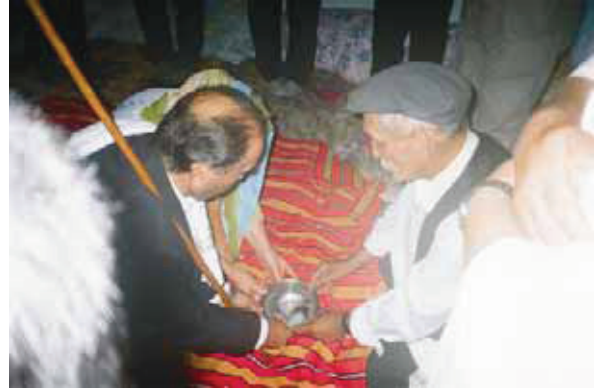
Fotoğraf 21: İmat ile Ana Bacı "saka suyu"nu dededen niyaz ettirirler

Daha sonra günahların bağışlanması için, tövbe (istiğfar) duası okunur. Bu duayı takiben tevhit bölümüne geçilir. Tevhit, iki bölümden oluşur. İlk bölümünde Ana Bacı'yla birlikte İmat, Sakka Suyu olarak kabul edilen bir tas suyu getirirler. Dede, "Hayıra himmet" der.